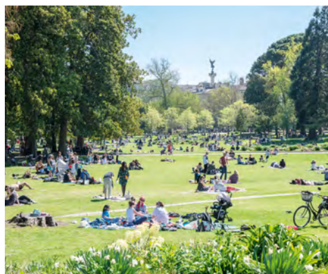
Le jardin public.