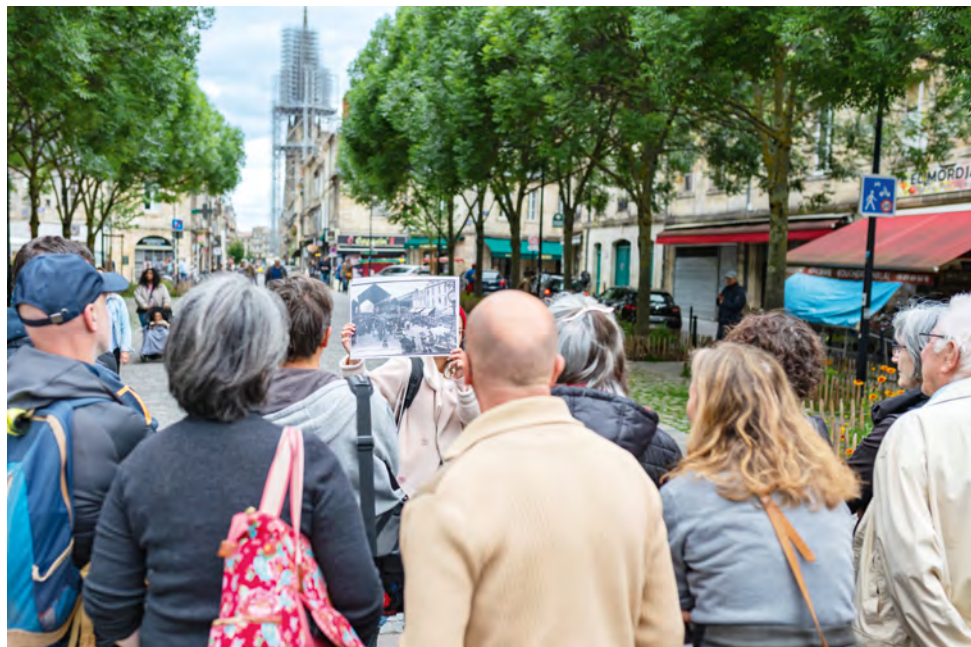
Visite de Saint-Michel.