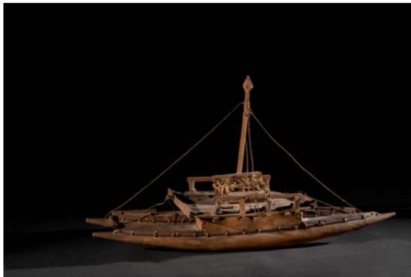
Maquette de pirogue. Nouvelle-Calédonie. Musée d'Aquitaine, Bordeaux.