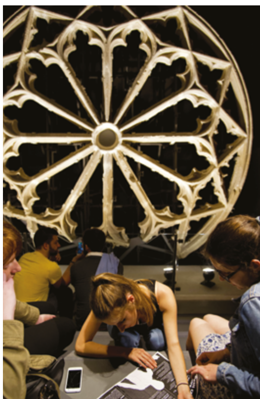
Rosace de l'église des Grands Carmes, 14 e siècle

faisant du musée d'Aquitaine l'un des 5 premiers musées d'Histoire en France