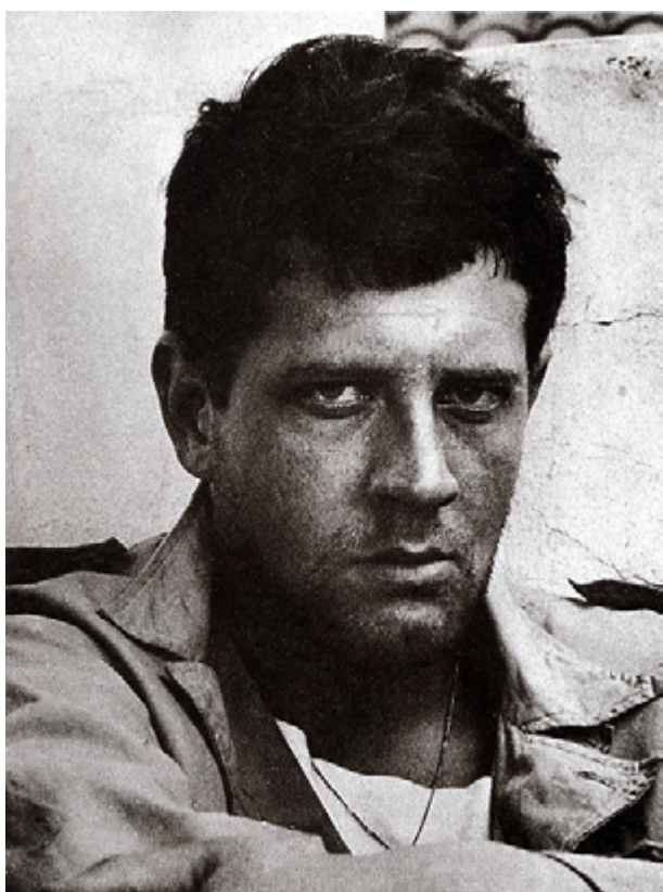
Hugo Pratt à Venise (1945)

© Cong S.A., Suisse. Tous droits réservés