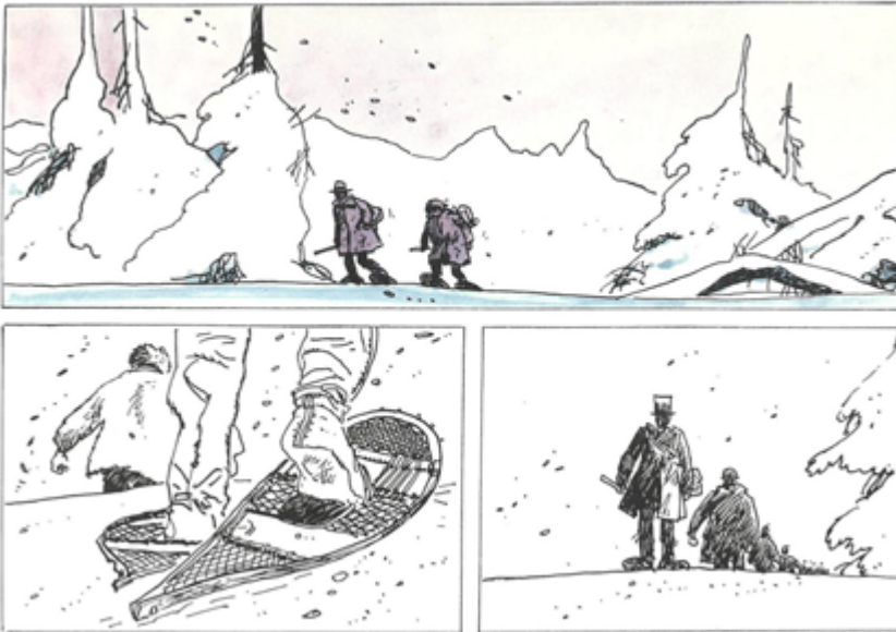
Projet d'une histoire inachevée (années 60)