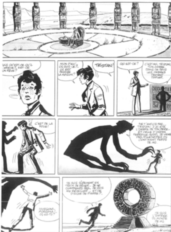
«Rendez-vous à Bahia» (1970) © Cong S.A., Suisse. Tous droits réservés