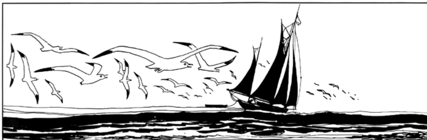
« Le secret de Tristan Bantam » (1970) © Cong S.A., Suisse. Tous droits réservés