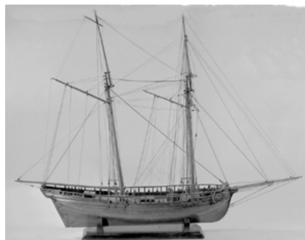
Maquette de Goélette. Musée d'Aquitaine, Bordeaux.