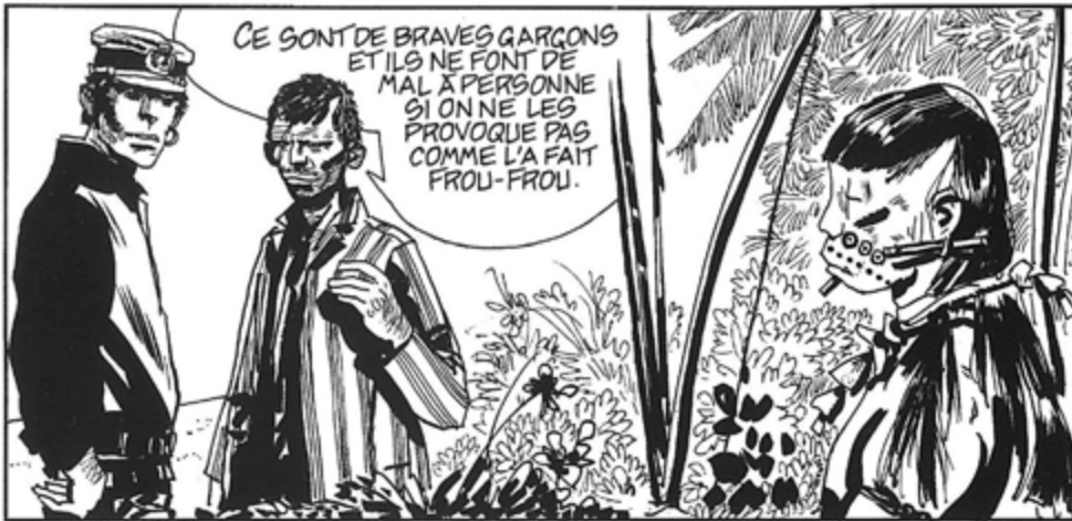
«Rendez-vous à Bahia» (1970) © Cong S.A., Suisse. Tous droits réservés