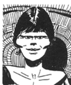
AMBIGUÏTÉ DE POINCY