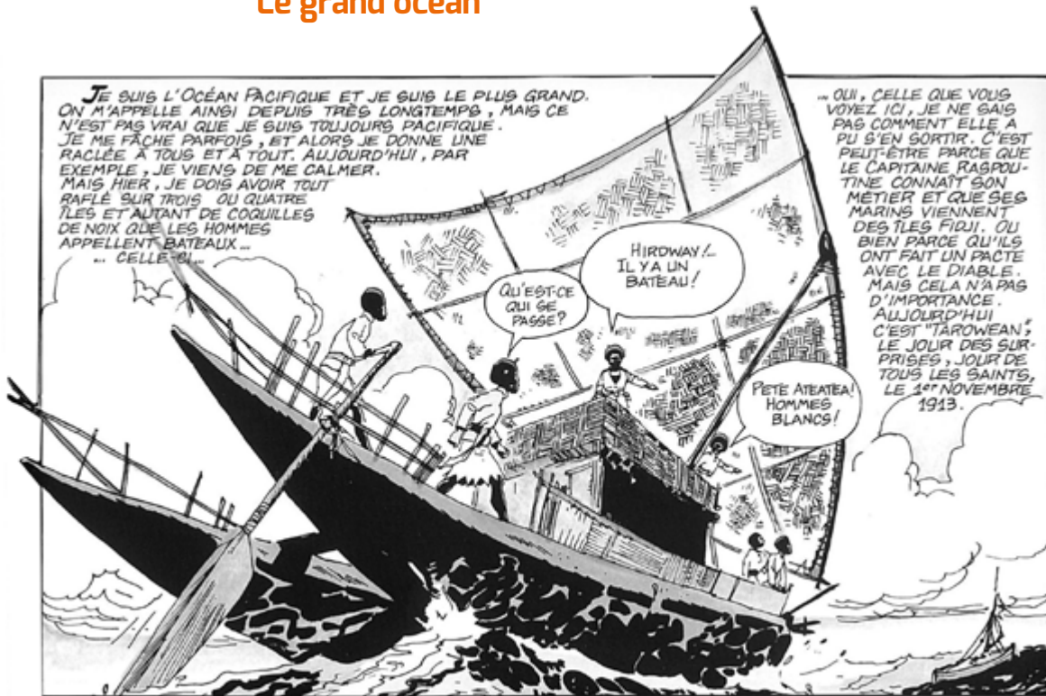
« La ballade de la mer salée » (1967)