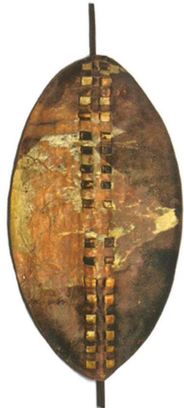
Bouclier Zoulou. Musée des Confluences, Lyon (France)