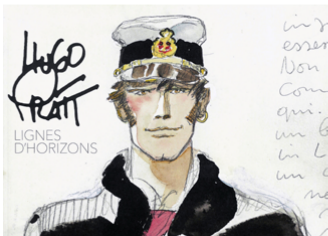
Revue Corto Maltese (1983)

L'exposition s'ouvrira par le parcours biographique d'un artiste cosmopolite et prolifique, influencé par la BD et le cinéma américain, mais aussi par la littérature, la poésie et l'histoire. Le visiteur découvrira la richesse de sa production de l'Italie de ses débuts jusqu'à la Suisse, en passant par l'Argentine et la France, avec un focus plus développé sur le personnage de Corto Maltese.