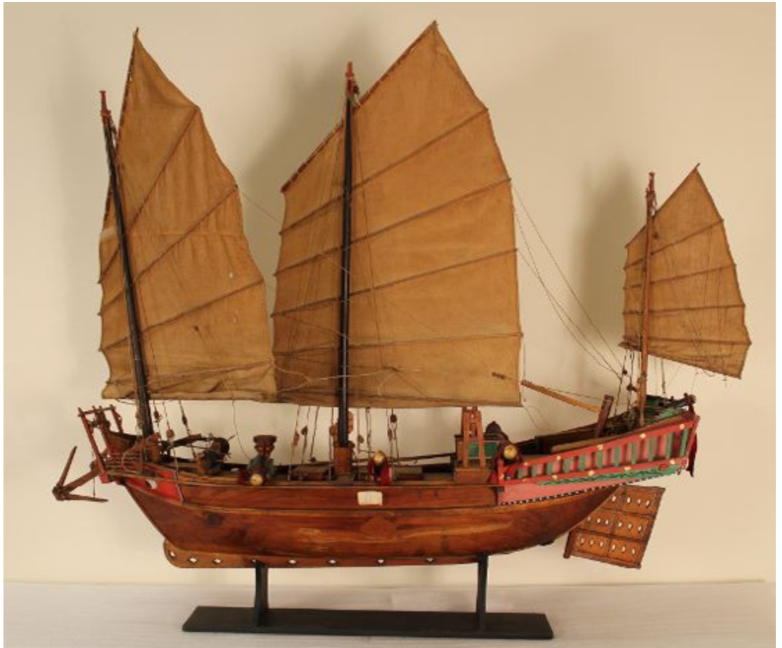
Modèle réduit de jonque de guerre chinoise présentée à l'Exposition universelle de Paris en 1878. Musée d'ethnographie de L'université de Bordeaux.