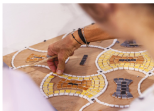
Atelier adultes mosaïque. Art-Mélioration © Florent Vannier