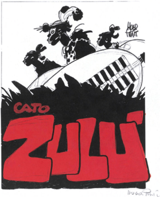
« Cato Zoulou » couverture italienne (1987) © Cong S.A., Suisse. Tous droits réservés