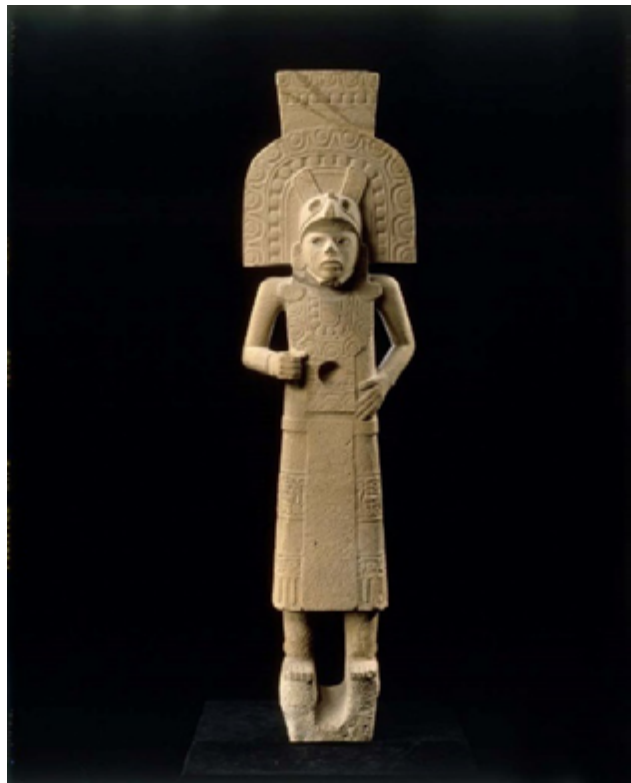
Statue Huastèque. Musée d'Aquitaine.