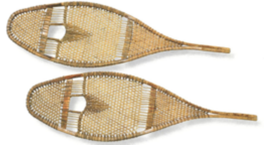
Raquettes. Hurons. Musée des Confluences, Lyon (France)