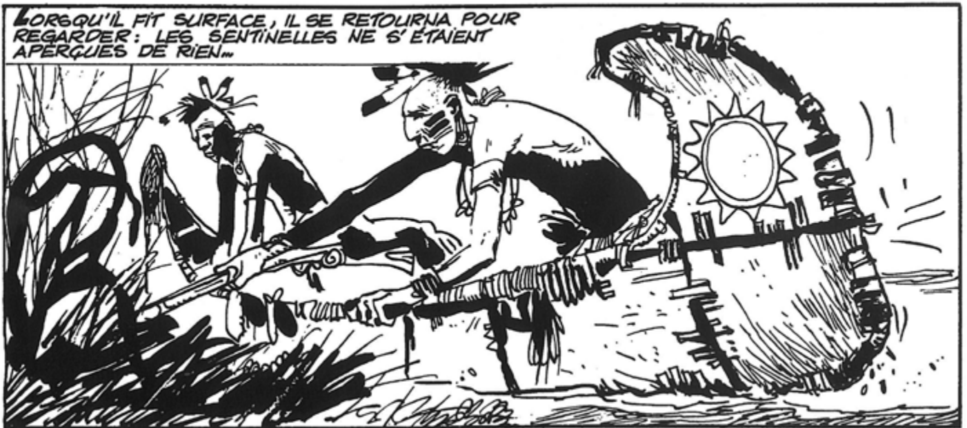
L'assaut du fort (1963) © Cong S.A., Suisse. Tous droits réservés