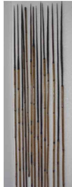
Flèches. Musée d'Aquitaine, Bordeaux.