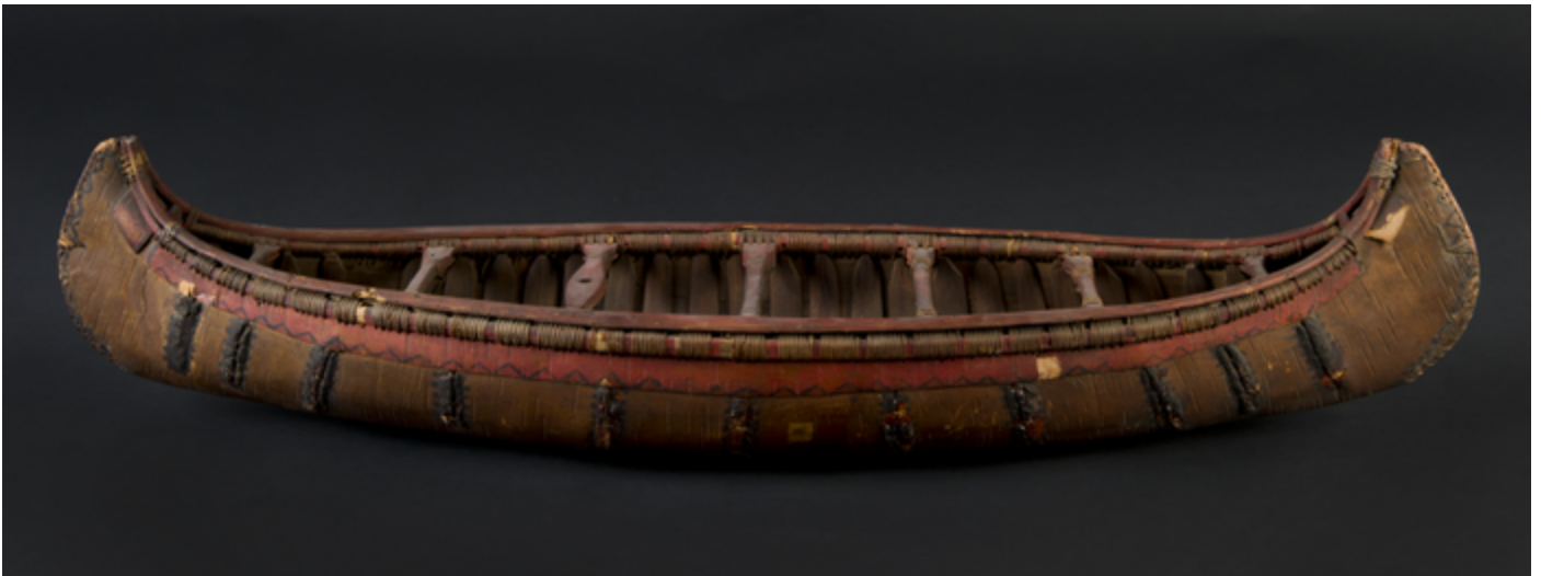
Maquette de canoë. Musée d'Aquitaine.